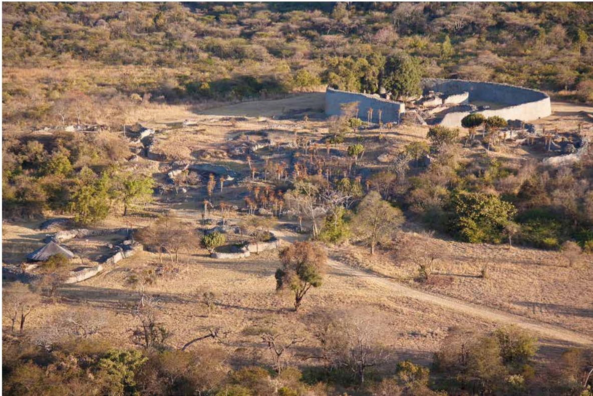
MEKTIG RIKE: Store Zimbabwe – Great Zimbabwe, de merkelige og fabelaktige ruinene ligger på et høyplatå nord for Sør-Afrika. Europeerne nektet å tro at shonafolket kunne ha skapt et sentralisert og mektig rike med rik byggekunst og med handelsforbindelser til så fjerntliggende steder som Asia.