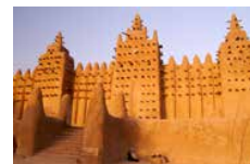
MALI: Den store moskéen i Djenné ble gjenoppbygd i 1907. Byens historiske senter er en del av verdensarven.

Min julegave. Jeg tror at alle som på ulike vis er interessert i dette enorme kontinentet, vil ha stor glede av å gi seg i kast med Afrika . I tillegg til alt boken har å by på, finner vi også en oppdatert og fylldig litteraturliste der forfatteren henviser til et stort antall bøker, ikke minst skrevet av afrikanske forfattere.